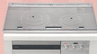
IHクッキングヒーター